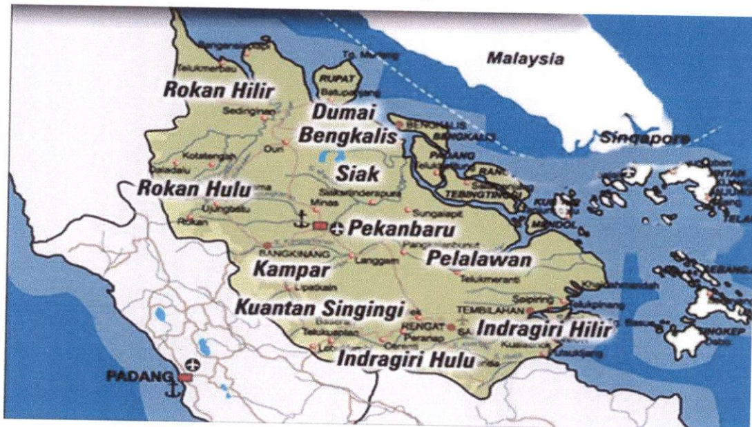
Gambar 1.2 Peta Wilayah Pekanbaru

Peta Wilayah Pekanbaru dapat dilihat sebagai berikut :